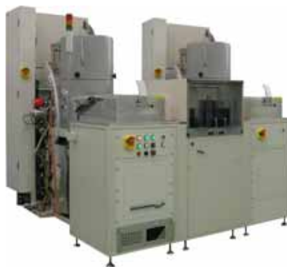
システム構成 (MPX- + MACS- ) 装置外観 (MPX- + MACS- Pegasus)